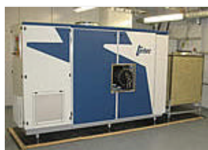
Mikrogasturbine Turbec 100 im DLR-Institut für Verbrennungstechnik

In der ersten Projektphase, die zunächst auf drei Jahre festgelegt ist, werden die Wissenschaftler unter anderem das Betriebskonzept erstellen sowie ein echtzeitfähiges Modell und die Regelung des Hybrid-Kraftwerks erzeugen. Als Ausstattung steht die im DLR-Institut für Verbrennungstechnik betriebene Mikrogasturbine samt Laboreinrichtung zur Verfügung. Siemens-Westinghouse liefert die SOFC-Brennstoffzelle mit einer Leistung von 5 Kilowatt, das DLR-Institut für Technische Thermodynamik betreibt die dafür notwendige Mess- und Prüftechnik in neu eingerichteten Labors. Die Partner der Universität Stuttgart bauen das Regelungssystem für die Gesamtanlage auf.